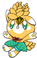
スクールキャラクター こんぼろちゃん